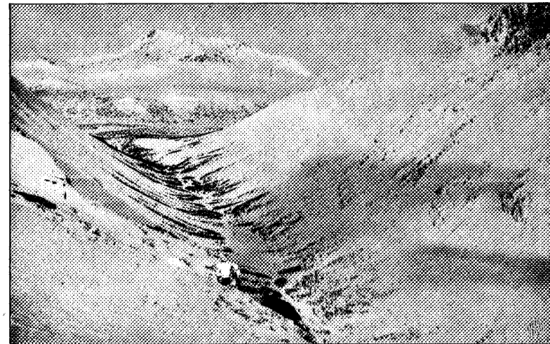
Svartaadalen med Snota.

Fra Jølvandet skar vi os opover lien langs Langfjeldet et godt stykke fremover, næsten mod Baagevoldsæteren, og saa bar det udover. Førstemand som satte iveri, forsvandt for os som stod igjen, for kort efter at dukke frem i rivende fart som en liden, svart flue dybt, dybt nede i dalbunden; og saa mand for mand efter. Det var et fint rend.