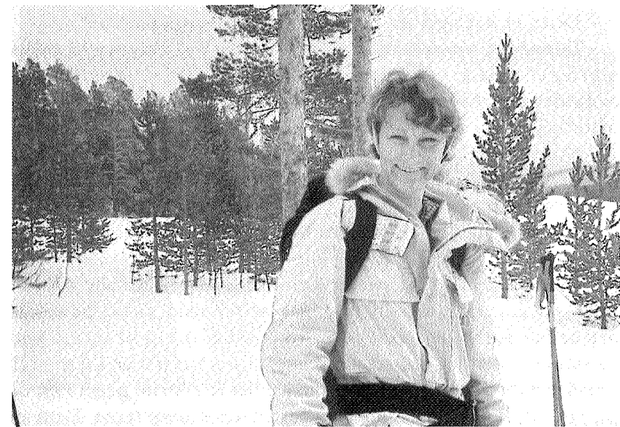
H.K.H. Kronprinsesse Sonja fotografert på en skitur i Rondane i 1984.

Skylstadbrekka. Filmen ble funnet av en svensk turist som fikk den fremkalt uten å gjenkjenne noen av personene. Han leverte derfor bildene til Verdens Gang, slik at avisen kunne etterlyse eieren. Der i huset så man naturligvis straks at Kronprinsessen gikk igjen på flere av bildene, og det ble tatt kontakt med en forespørsel om det var mulig å få trykke noen av dem. Tillatelse ble gitt under fortsetning av et honorar til H.K.H. Prinsesse Märtha Louises Fond for funksjonshemmede barn.