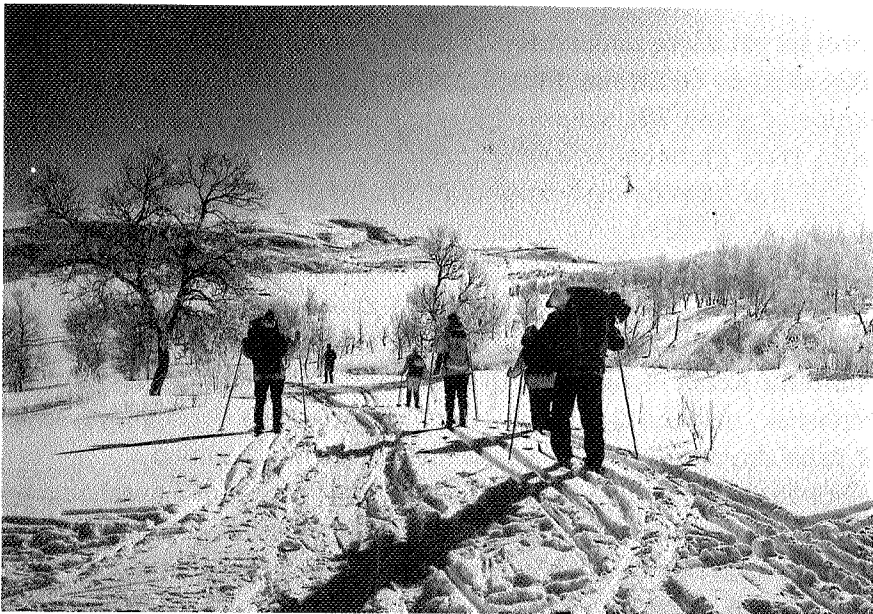
Følget legger ut fra Marenvollen ved Røros. Bildet er tatt av H.K.H. Kronprinsessen, som ble igjen på hytta for å vaske gulvene.

- Og så var det ny sommertur i Trollheimen samme år?